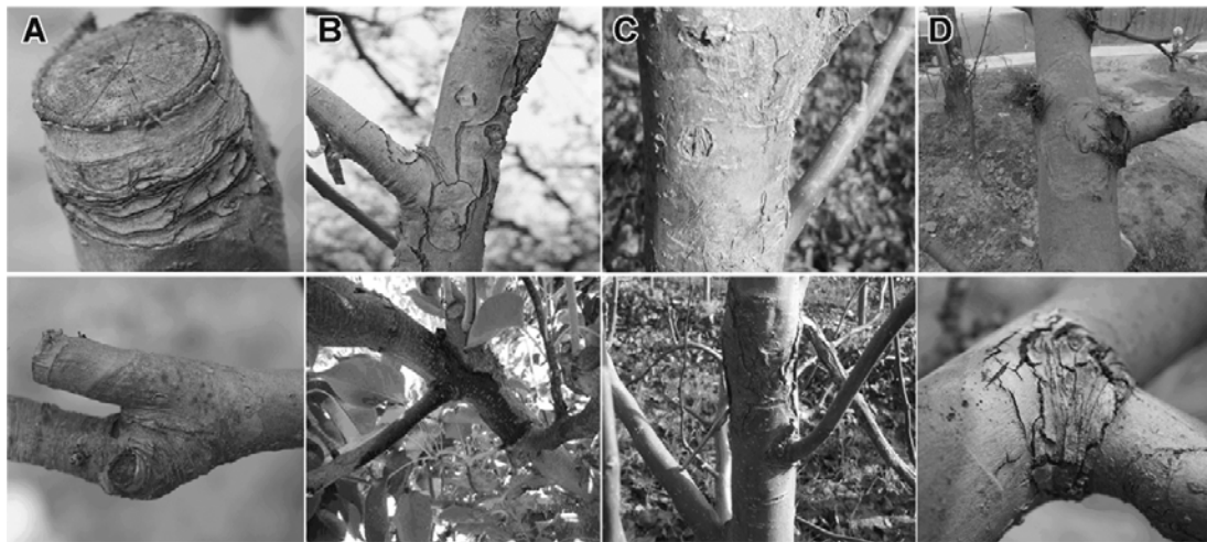
A 剪锯口; B 冻害与日灼; C 其他机械损伤 (开角撑枝伤口、机械擦伤、刻芽等); D 分枝处

A, cut of pruning; B, wound by freezing and/or sunburn; C, mechanical damage (Open angle support branch, scratch and bud carved etc.); D, crotch of tree